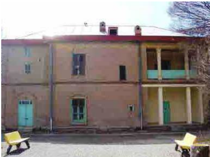
احمد آباد - آرامگاه دکتر محمد مصدق

آنچه همگان، اعم از مرد و زن ایرانی در باره مصدق می دانیم این است که او برای تغییر و تحول تدریجی در ساختارهای اقتصادی، اجتماعی، فرهنگی و سیاسی ایران، صاحب یک مکتب فکری تاریخی بود. وی بر اساس تز " موازنه منفی " عمل می کرد که قرنهایست در ادب و فلسفه و هنر ایرانیان پرداخته شده بود. از دید مصدق عمل به این اندیشه، یعنی بسط و گسترش مردمسالاری در جامعه ملی ایران بر اصول آزادی، استقلال و رشد در عدالت. او در آخرین دفاعیه اش، بزرگترین جرم خود را عمل بر اساس همین اندیشه می داند زیرا وی تلاش کرد به جامعه ملی نشان دهد می تواند از زیر بار سلطه خارج شود بدون اینکه سلطه گر شود. او هدف خود برای خارج کردن سلطه گران خارجی از کشور و حاکم گرداندن مردم بر مقدرات خود را این چنین عنوان می کند: "می خواهم از روی حقیقتی پرده بردارم ... این اولین بار است که يك نخست وزیر قانونی را به حبس و بند می کشند... چرا؟ برای من خوب روشن است. می خواهم طبقه جوان مملکت که چشم و چراغ و مایه امید مملکت هستند، علت این شدت عمل را بدانند و از راهی که برای طرد نفوذ استعمار بیگانگان پیش گرفته اند منحرف نشوند و از مشکلاتی که در پیش دارند نهراسند و از راه حق و حقیقت باز نمانند. به من گناهان زیادی نسبت داده اند ولی من خودم می دانم که يك گناه بیشتر ندارم و آن این است که تسلیم خارجی ها نشده و دست آنها را از منابع طبیعی ایران کوتاه کرده ام و در تمام مدت زمامداری، يك هدف داشتم و آن این بود که ملت ایران بر مقدرات خود مسلط شود و هیچ عاملی جز اینکه ملت در تعیین سرنوشت مملکت دخالت کند نداشتیم ". (۴)