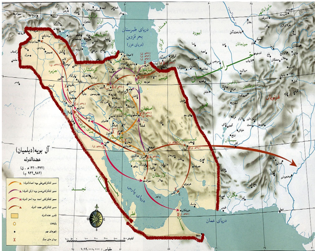
آل بویه (دلمیان) 932-982 عیسوی