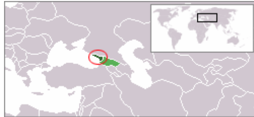
آبخاز در گرجستان و باختر آسیا.