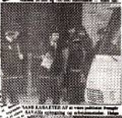
De 16 demonstrerende iranere, der blev arresteret i København, er nu i fængsel i Iran.

Shahens politiet IYER LAMU Fremde minister udsatte forlygtige omne gæstene og Iran. De beklæmede gives dete minister af Mohideh Bahmani. og omne gæstene. IYER LAMU Fremde minister udsatte forlygtige omne gæstene og Iran. De beklæmede gives dete minister af Mohideh Bahmani. og omne gæstene.