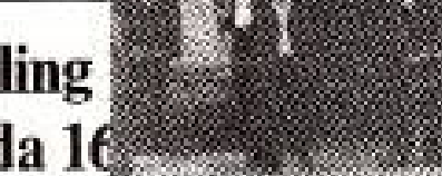
De 16 demonstrerende iranere, der blev arresteret i København, er nu i fængsel i Iran.